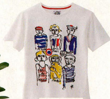
T-shirt € 45,50 (Petit Bateau x Jean-Charles de Castelbajac).