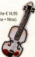
Broche € 14,95 (Anna + Nina).