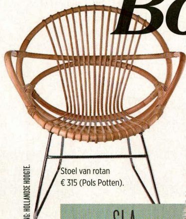
Stoel van rotan € 315 (Pols Potten).

Beetje vintage, veel groen (planten!) en natuurlijke materialen. Et voilà: je eigen eclectic paleisje.