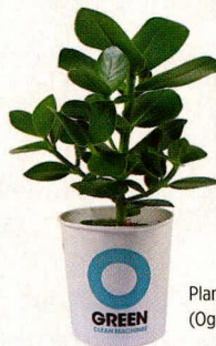
Plant € 9,50 (Ogreen).