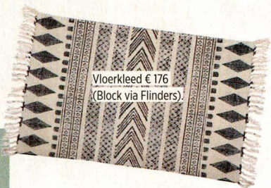
Vloerkleed € 176 (Block via Flinders).